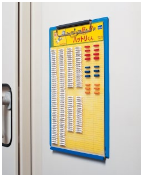
マグネット付バインダー MTH-B(別売り)