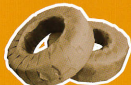
梱包形態は紙巻となっております。内径が約15cmの小巻タイプとなっております。