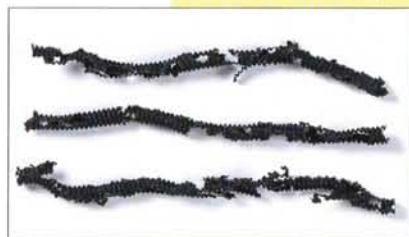
[ねずみ被害にあった忌避剤含有なしのコルゲート管]